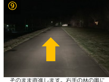
⑨ そのまま直進します。右手の林の奥にエールセンター十勝が見えてきます。