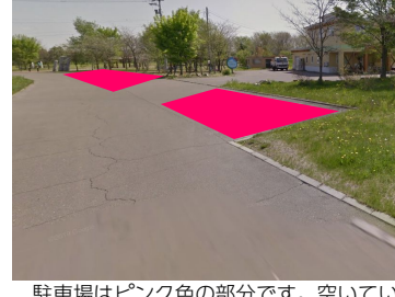
⑩ 駐車場はピンク色の部分です。空いていなければスタッフにお声がけください。