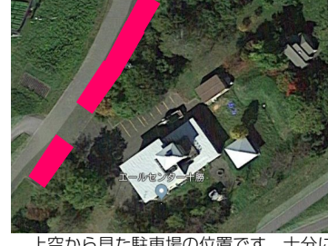
⑩ 上空から見た駐車場の位置です。十分に駐車スペースがございますので、ご安心ください。