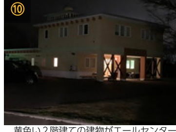
⑩ 黄色い2階建ての建物がエールセンター十勝です。到着です。