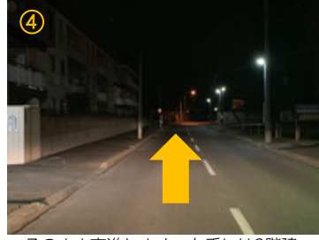
④ そのまま直進します。左手には3階建ての集合住宅が見えてきます。