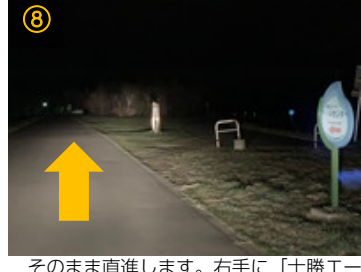
⑧ そのまま直進します。右手に「十勝エールセンター」と書かれた看板が見えてきます。