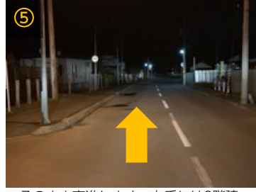
⑤ そのまま直進します。右手には2階建ての集合住宅が見えてきます。