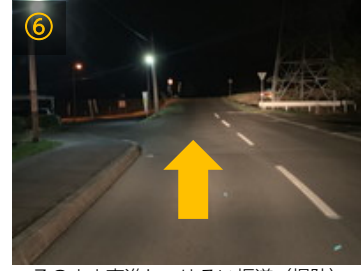
⑥ そのまま直進し、ゆるい坂道（堤防）を登ります。