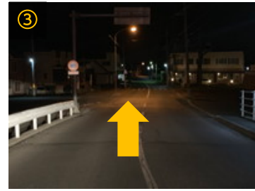
③ そのまま直進します。右手には帯広東内科循環器科クリニックが見えてきます。