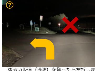
⑦ ゆるい坂道（堤防）を登ったら左折します。坂道を下って直進しないでください。